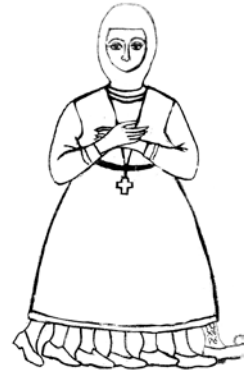
Χρηματίδιο της κυρας Σαρακοστής

Κάθε Σάββατο έκοβαν ένα πόδι κι έτσι ήξεραν πόσες βδομάδες νηστείας απέμεναν μέχρι το Πάσχα. Το Μεγάλο Σάββατο έκοβαν και το τελευταίο πόδι.